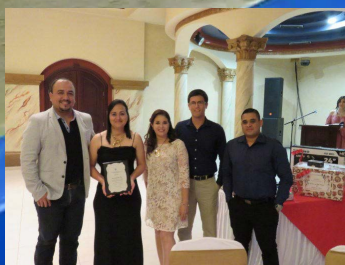
RECONOCEN LABOR DE MIEMBROS DE LA JUNTA DIRECTIVA Y EMPLEADOS CON TRAYECTORIA. PÁGINA 7