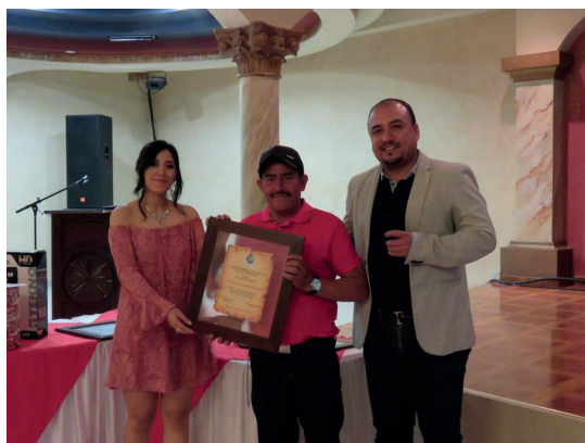
Varios empleados de “Aguas de Siguatepeque” también fueron homenajeados.