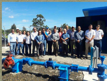
PROMOSAN UN ÉXITO EN SIGUATEPEQUE. PÁGINA 8

AÑO 1/ EDICIÓN 1/ ENERO 2018 www.aguasdesiguatepeque.com